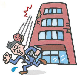
[通行人の死傷など]